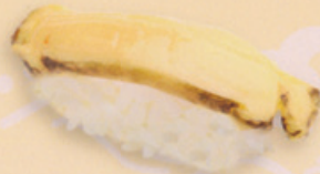
38 Awabi 鮑 market price