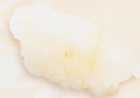
28 Hirame 平目 € 5,00