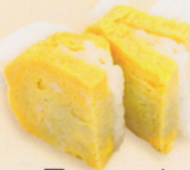
24 Tamagoyaki 卵焼き € 3,00