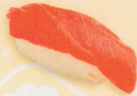
35 Toro とろ € 8,00