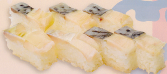
17 Battera ばってら € 20,00