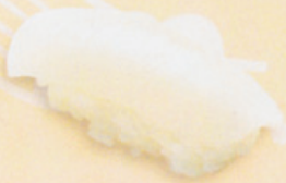
20 Ika いか € 4,00