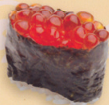
34 Ikura いくら market price