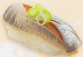
23 Iwashi 鯉 € 3,00