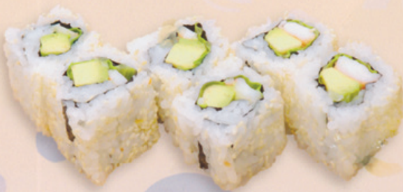
16 Californiamaki カリフォルニア巻き € 10,00