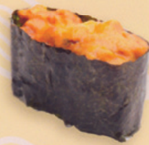
36 Uni うに market price