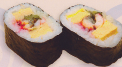
18 Futomaki 太巻き € 25,00