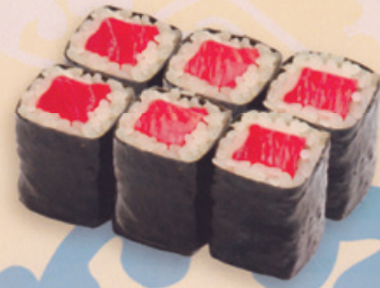
15 Toromaki とろ巻き € 10,00