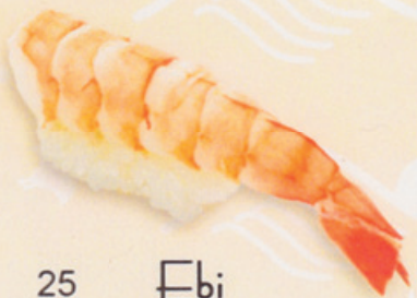
25 Ebi 海老 € 5,00