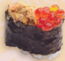
39 Kani 蟹 market price