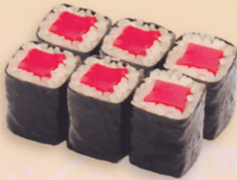
13 Tekka 鉄火巻き € 8,00