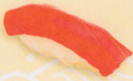
31 Maguro 鮪 € 6,00