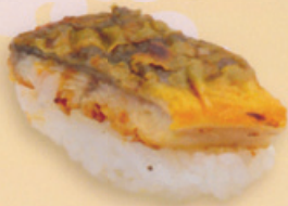
33 Unagi 鰻 € 5,50