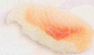
32 Hamachi はまち € 8,00