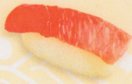
35 Chu-Toro 中とろ € 8,00