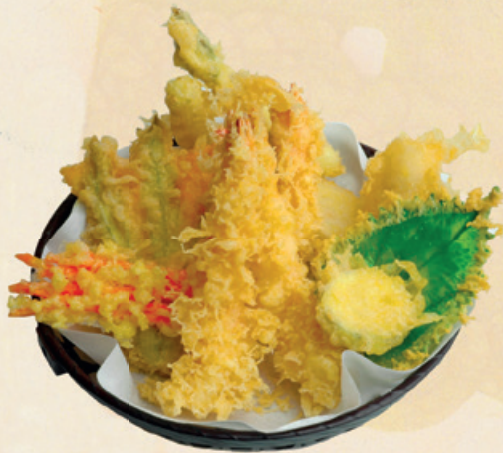
50 Tempura groß