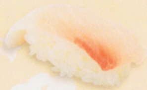
21 Kanpachi かんぱち € 8,00