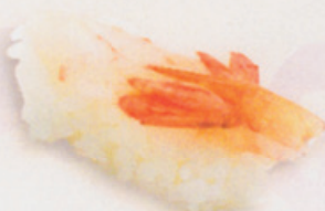
30 Amaebi 甘海老 € 5,00