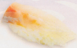
29 Suzuki 鱈 € 6,00