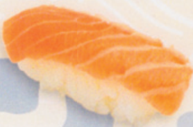
26 Shake 鮭 € 6,00