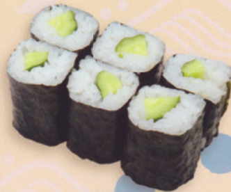
14 Kappa がっば巻き € 5,00