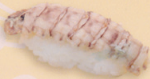
37 Shako 蝦蛄 market price