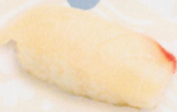
27 Tai 鯛 € 6,00